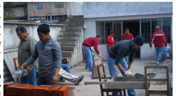
Mezclando cemento y mortero, colocando ladrillos y cargando grava, todo ésto a 3295 Mt de altura en Túquerres, Colombia.