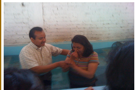
Una de los seis bautizados en Cuautitlán, cerca de la Ciudad de México durante la campaña..