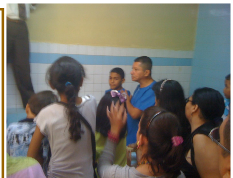
Uno de los siete bautismos en Venezuela esa semana del retiro, este en Caracas.