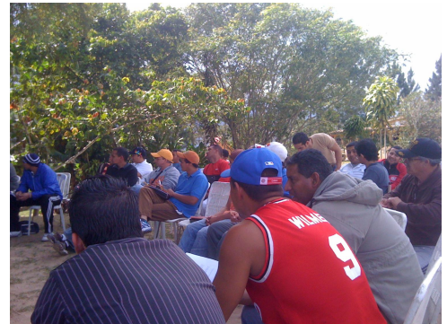
68 predicadores estuvieron en el retiro de Venezuela en el centro del país. ¡Tremendo ejemplo de unidad!

“Y que el Dios de paciencia y del Consuelo os conceda tener el mismo sentir los unos para con los otros conforme a Cristo Jesús.” Rom. 15:5